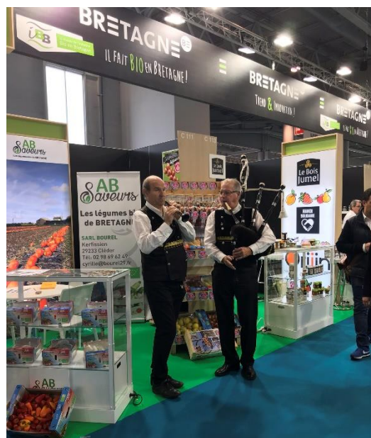
Photos du Pavillon « Il fait Bio dans mon assiette » - NATEXPO 2019 – Paris