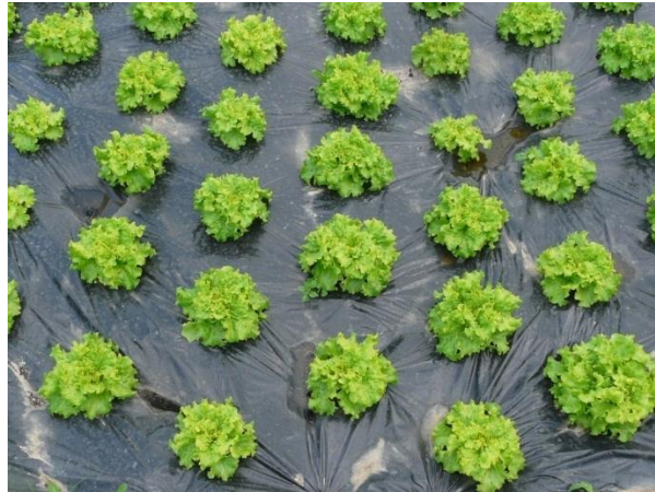
Figure 2 : Parcelle utilisée pour la production de laitue avec et sans traitement au Scutello® réalisé afin de distinguer et tracer la souche de bioinsecticide du champ à l'assiette

2003). Ces dénombrements ont été réalisés en triplicat avec en parallèle le dénombrement de flore totale et spores, permettant de distinguer la proportion de Bacillus sous forme de cellules végétatives ou sous forme de spores. Dans les conditions de notre étude, le traitement au Scutello® doublait donc la contamination en spores de B. cereus présumés et ce niveau de contamination se maintenait sous forme de spores tout au long du process et du stockage de la purée de brocoli. Les taux de contamination dans les prélèvements de terre avant ou après traitement au Scutello® étaient quant à eux de l'ordre de 5 log UFC/g.