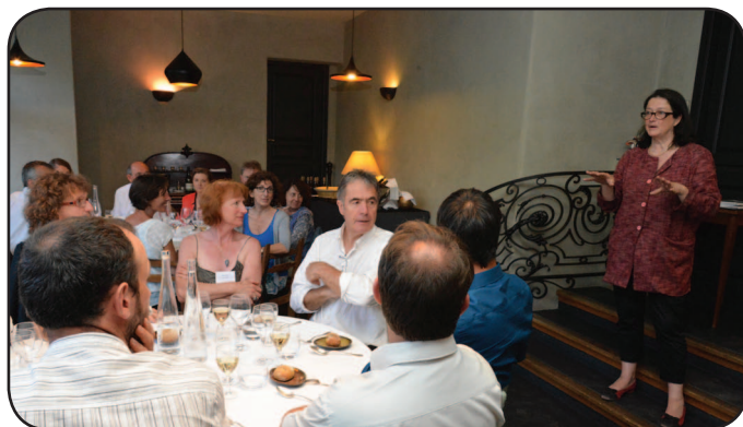
Dîner organisé par IBB au restaurant LeCoq-Gadby (Rennes) à l'occasion du voyage de presse de l'Agence Bio en juin 2014

Activité : Approvisionnement de la restauration collective en produits Bio pour le département 56, en direct des producteurs.