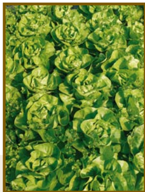
▲ Variété Hiver de Vermières