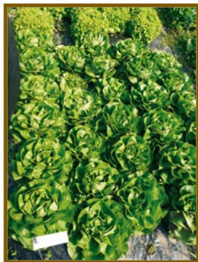
▲ Variété Cellia

Au niveau visuel, les différences sont également importantes, certaines laitues produisant une belle pomme, alors que d'autres n'en font pas ou très peu, comme le montrent les photographies ci-dessous.