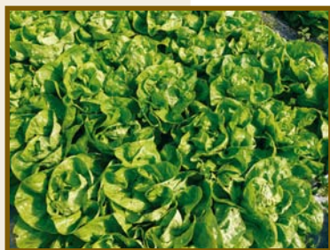
▲ Variété Merveille d'Hiver