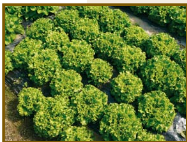
▲ Variété Jazzie