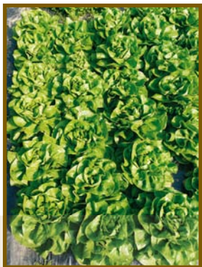
▲ Variété Colber