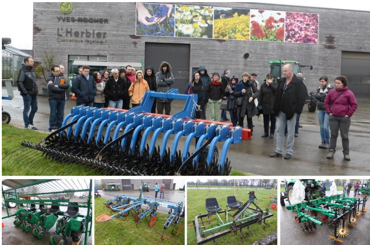
Présentation du matériel de culture des PPAM biologiques sur le site Yves Rocher à La Gacilly

Au niveau agronomique, l'objectif est d'allonger les rotations pour limiter le salissement. Le désherbage est un levier majeur de maîtrise des cultures. Des rotations plus longues permettent également de contrer le problème de sclérotinia. La rotation type est la suivante : engrais vert (2 types sont implantés : couverts mellifères et couverts apportant une diversité intéressante pour la fertilité, la structure des sols, et le contrôle des adventices, maladies et ravageurs) durant 3 ans – mélange blé/pois/féverole – PPAM. Un apport de fumier de porc composté et des engrais verts enrichissent le sol. Peu de labour, le sol est travaillé à 3 / 4 cm avant semis. Un arrosage (canon) est pratiqué en appoint sur le sol argileux peu profond. La durée de culture des plantes cosmétiques n'est que de 2 à 3 ans pour éviter un trop fort salissement. Des expérimentations sont menées, et appelées à se développer, dans l'objectif de déterminer de nouvelles plantes cosmétiques, améliorer les itinéraires techniques, et avancer sur les techniques agricoles limitant le travail et les apports, et enrichissant la diversité.