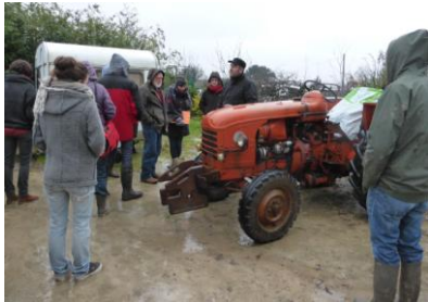
Tracteur d'occasion, bineuse à doigts Kress.

Au Champ de l'Air, beaucoup de matériel d'occasion, adapté et amélioré par les compétences familiales quand nécessaire ! Ancien tracteur, petite herse, bineuse à doigts Kress, houe maraichère et girobroyeur côtoient une petite moissonneuse batteuse (pour fenouil, aneth, coriandre) et une ancienne batteuse/trieuse adaptée aux besoins de la ferme (pré-tri thym, sarriette, romarin, isopé).