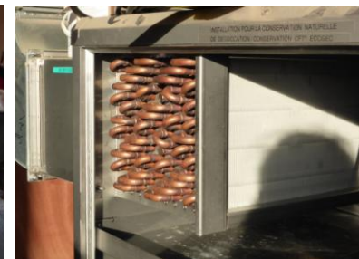
et séchoir à déshumidification CFT