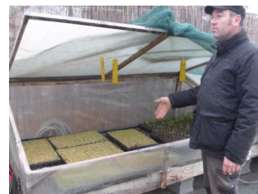
Semis en châssis.