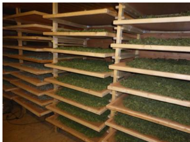
Séchoir avec ventilation

Plusieurs types de séchoirs sont présents sur l'exploitation, de l'ancien séchoir à tabac des débuts, au très performant séchoir à déshumidification CFT, investissement lourd qui permet un séchage rapide de qualité optimale. Entre ces deux extrêmes, séchage au sol en grenier ou sur claies dans un séchoir avec ventilateur sont également utilisés. Le large panel de séchoirs permet d'assurer au mieux cette phase délicate pour les 52 plantes transformées.