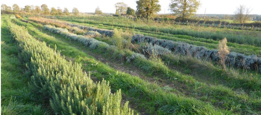
Le Champ de l'Air