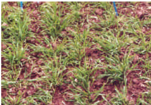
Triticales au stade Tallage

Au niveau qualité, il est difficile de faire un classement, les résultats étant sensiblement les mêmes quelles que soient les variétés. On retiendra cependant un taux de protéines assez faible puisque inférieur à 10% quelle que soit la variété.